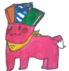
図書館キャラクター ほんのすけ